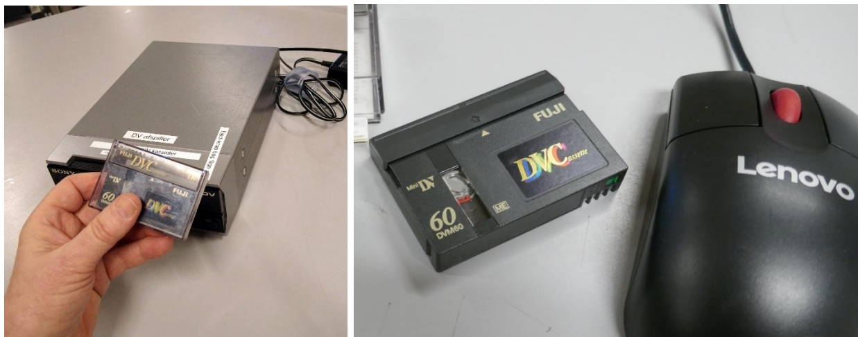
Herover: MiniDV-bånd og afspiller – og en mus til at illustrere størrelsesforholdet.

https://www.youtube.com/@digitaliseringsvrkstedkben8322